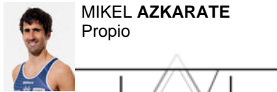
MIKEL AZKARATE Propio