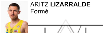
ARITZ LIZARRALDE Formé