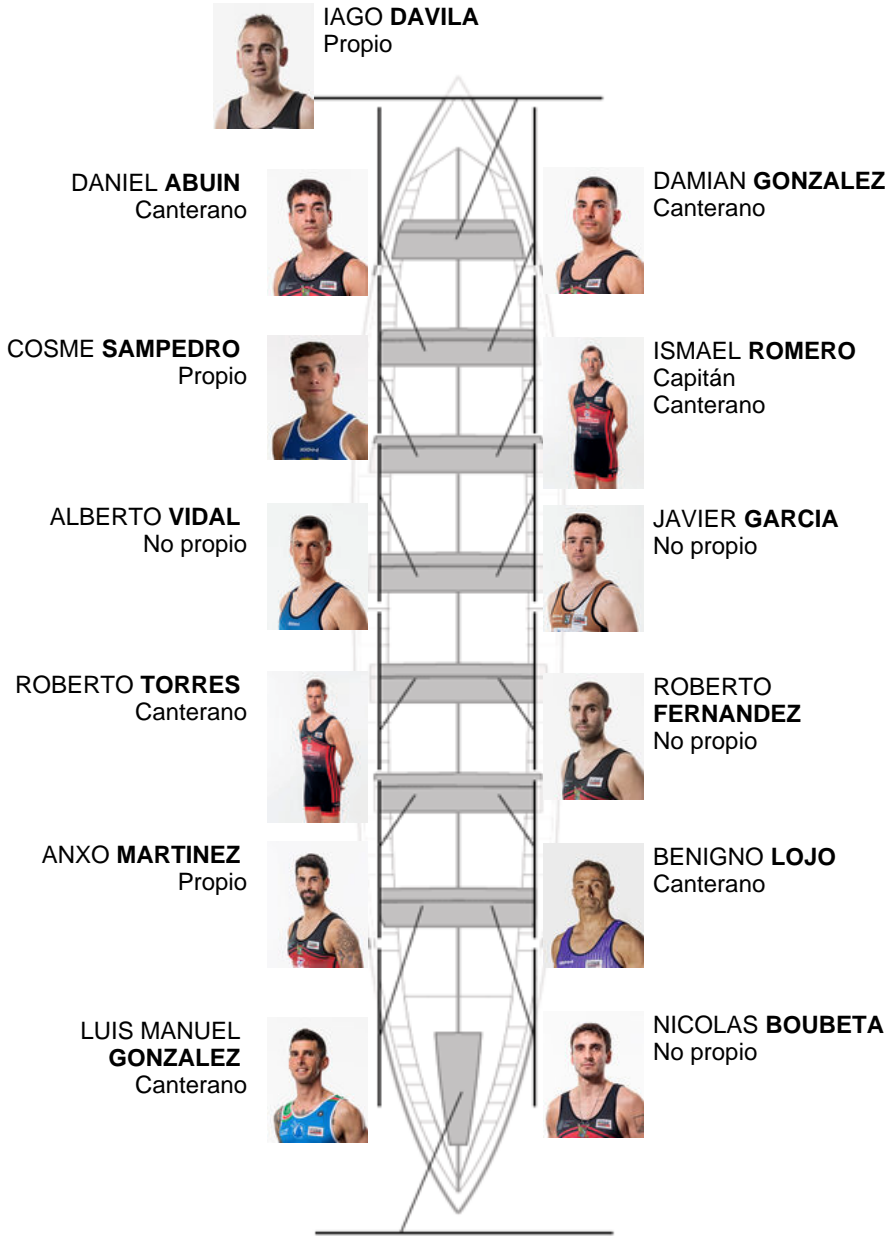
MANUEL TRIÑANES Canterano